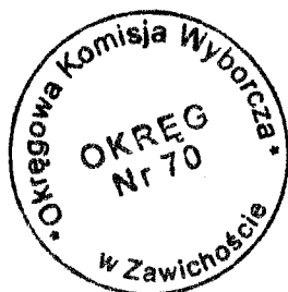
Przewodniczący Okręgowej Komisji Wyborczej

(imię/imiona i nazwisko, miejsce zamieszkania; lub nazwa i adres siedziby osoby prawnej)