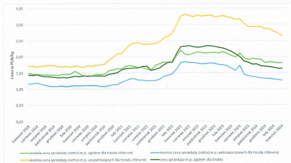
Wykres 1. Ceny mieszanek paszowych (m.p.) w Polsce od IV 2019 do IV 2024 (w PLN/kg)