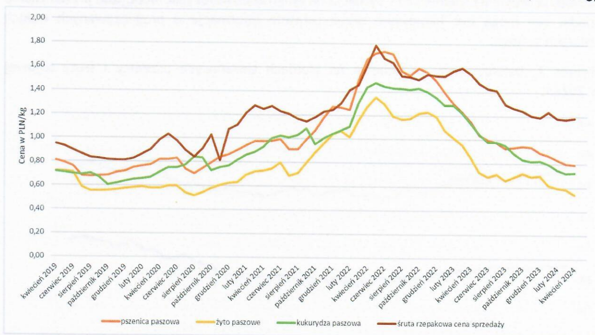
Wykres 2. Ceny krajowych surowców paszowych w Polsce od IV 2019 do IV 2024 (w PLN/kg)